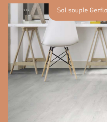
Sol souple Gerflor